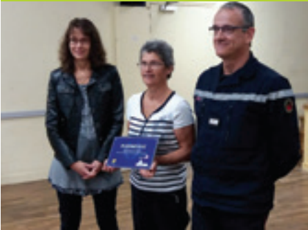
Le label adresse de Platine remis à la commune lors de la remise officielles des numéros de maisons le 01/10/2016

> Votre adresse est désormais précisée par un numéro. Alors, si vous ne l'avez pas encore fait, venez retirer votre numéro aux horaires d'ouverture de mairie.