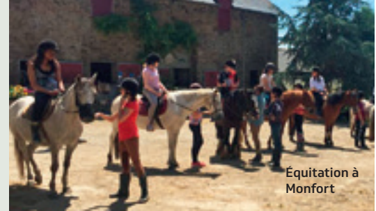
Équitation à Monfort