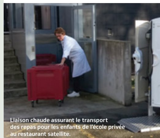
Liaison chaude assurant le transport des repas pour les enfants de l'école privée au restaurant satellite.

Par délibération du 17 octobre 2016, le Conseil Municipal a approuvé l'adhésion