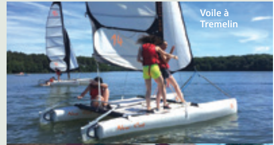
Voile à Tremelin