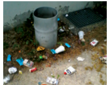
Poubelle située à l'entrée Est du groupe scolaire

MERCI de préserver la tranquillité des promeneurs.