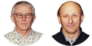
Patrick Le Texier / Jean-Yves Auffray

Autoriser Madame le Maire à signer la convention